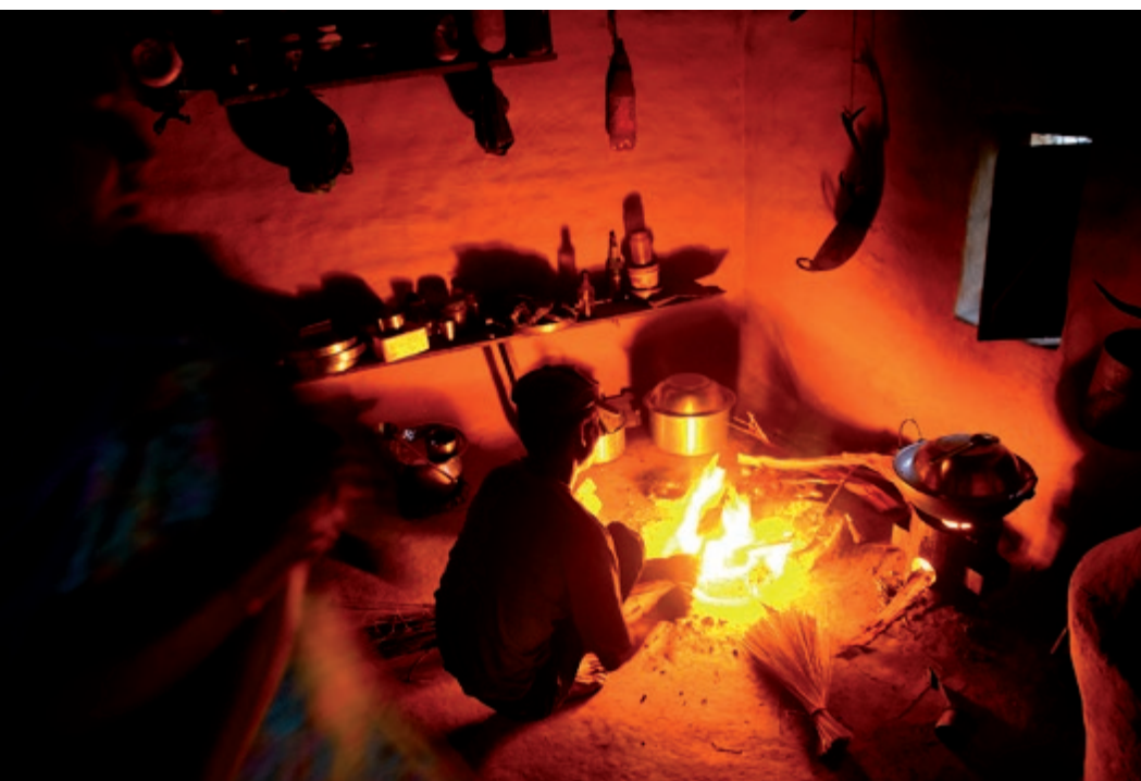
...til det spændende køkken i Teraien. Vi skal naturligvis have det hele med!