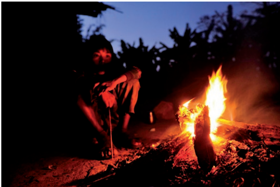
Om aftenen sidder vi rundt om bålet og lærer om Tharu-kulturen.