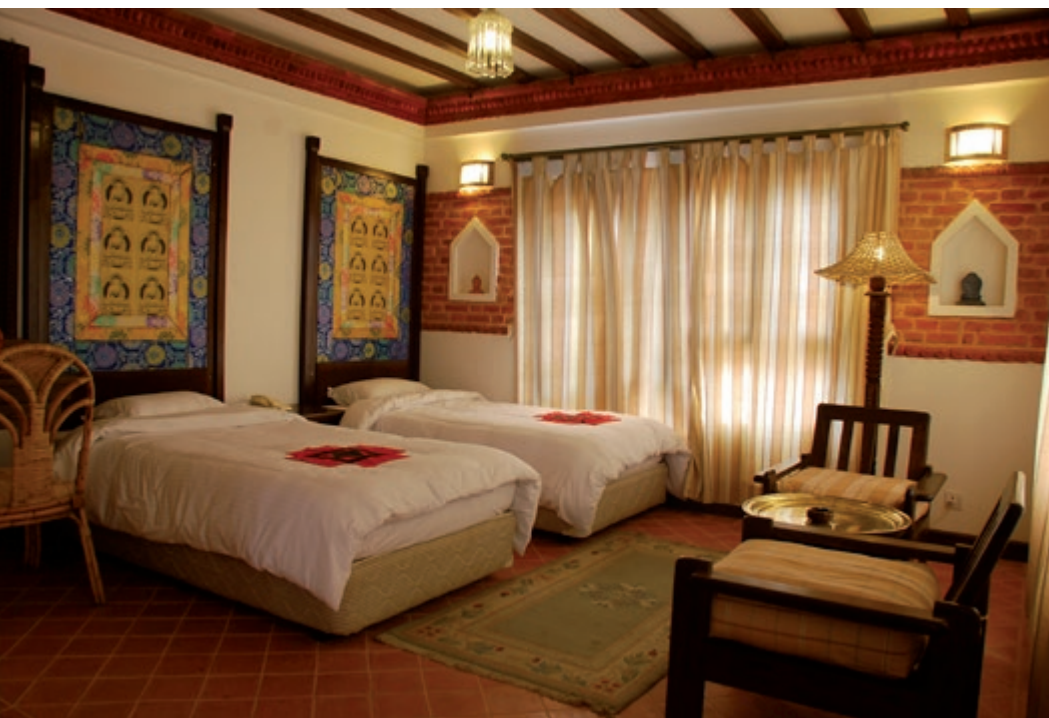
Fra lækre hoteller af europæisk standard i Kathmandu...