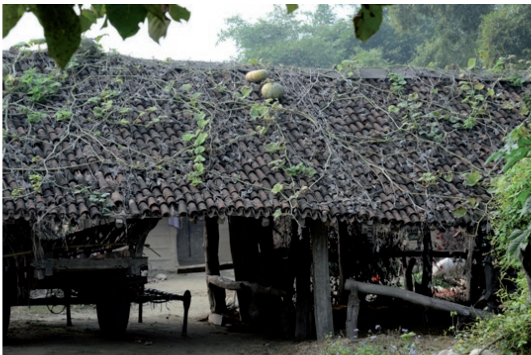
Ingen butikker i nærheden, så alle solbeskinnede arealer udnyttes til afgrøder.